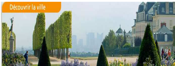
Découvrir la ville